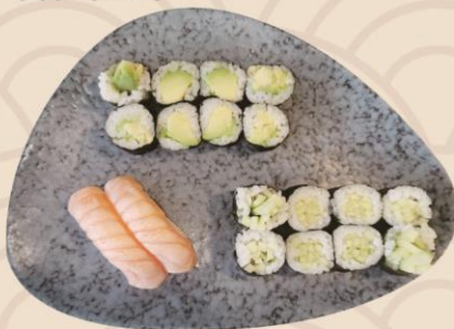
22. Børnemeny (18stk) 88kr

Uramaki: 8 sparkling tun 8 crispy ebi 8 california 8 laks