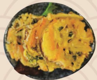
5. Kakiyaki med grønsager (3stk) 35kr