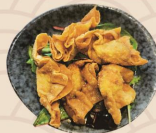
4. Dybsteget wonton (6stk) 45kr