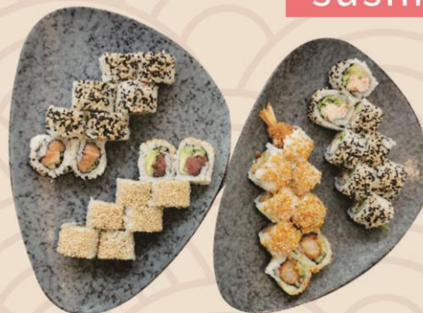
21. Maki Menu (32stk) 288kr

Topping maki: 8 rainbow. 8 ebi panko 8 sunshine