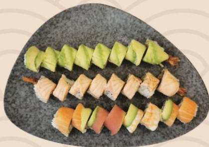
20. Maki deluxe (24stk) 288kr

Topping maki: 8 rainbow. 8 ebi panko 8 sunshine