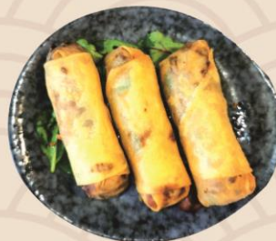
3. Forårssruller med oksekød (3stk) 40kr