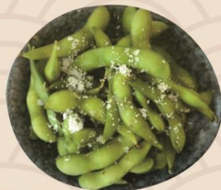
2. Edamame bønner med havsalt 35kr