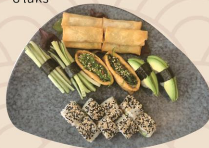
23. Vegetar meny (14stk) 138kr

Nigiri: 2stk flamberet laks Hoso: 8stk avocado, 8stk agurk